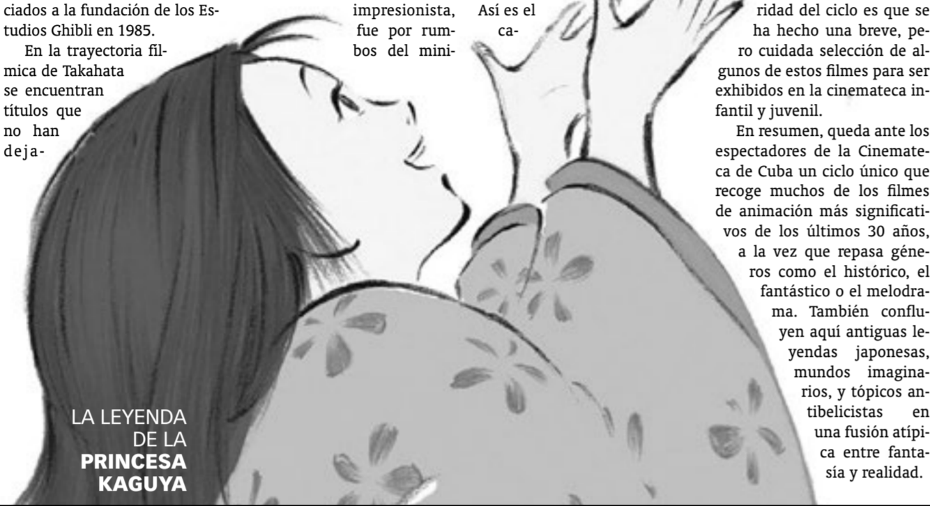
LA LEYENDA DE LA PRINCESA KAGUYA

En resumen, queda ante los espectadores de la Cinemateca de Cuba un ciclo único que recoge muchos de los filmes de animación más significativos de los últimos 30 años, a la vez que repasa géneros como el histórico, el fantástico o el melodrama. También confluyen aquí antiguas leyendas japonesas, mundos imaginarios, y tópicos antibelicistas en una fusión atípica entre fantasía y realidad.