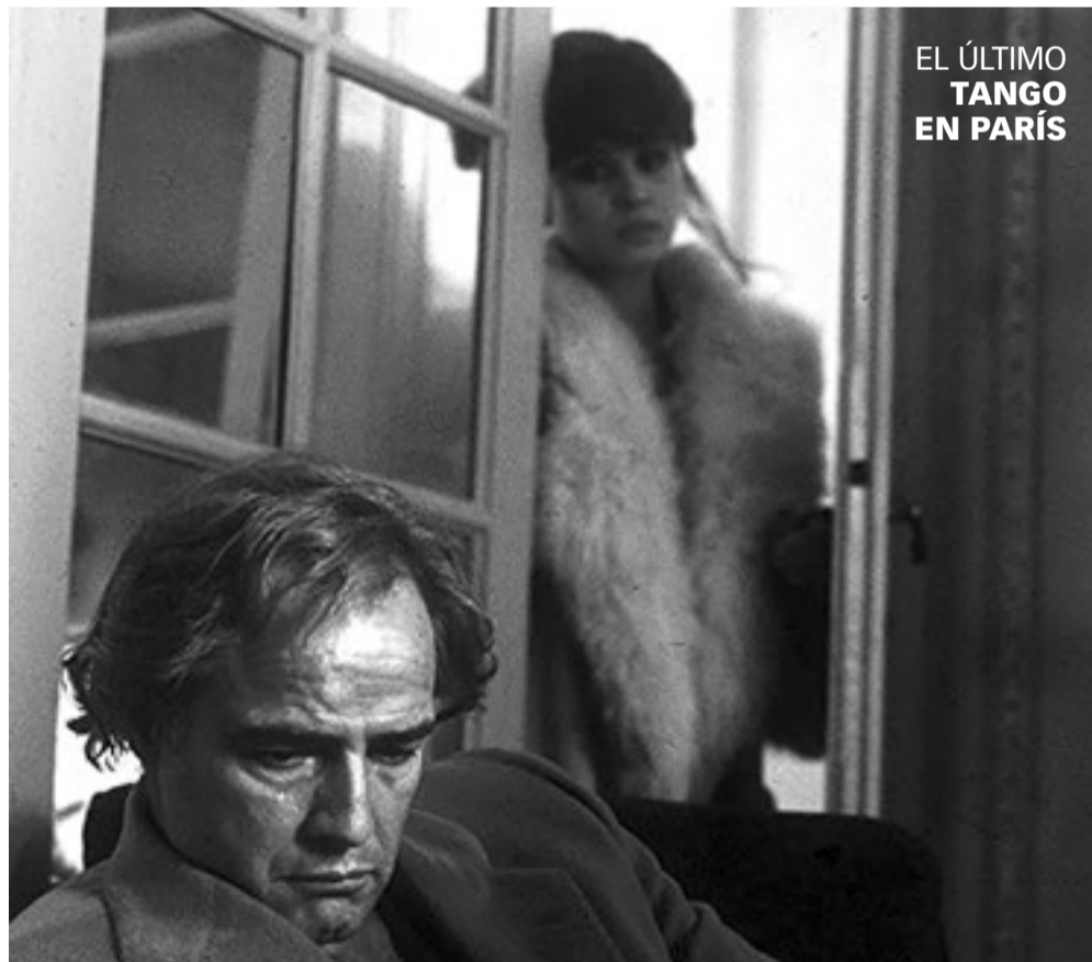
EL ÚLTIMO TANGO EN PARÍS

Dom. 2: CAPONE/ EU/ 1975/ 101'/ Steve Carver/ Ben Gazzara, Harry Guardino, Susan Blakely/ Drama/ 16 años. El famoso gánster Al Capone controla el hampa de Chicago, pero ahora debe enfrentarse al gran número de rivales que se oponen a su dominio.